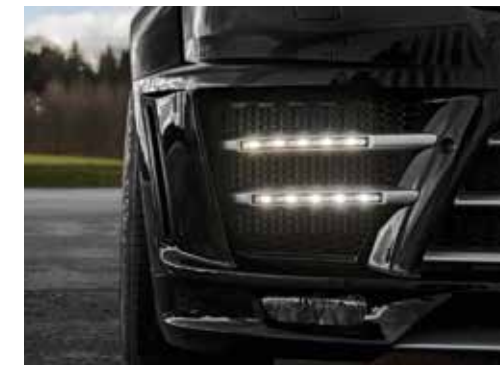
Doppel-Tagfahrleuchten in LED-Technik chrom (Serie)

Double-daytime running lights LED-technology chrome (standard)