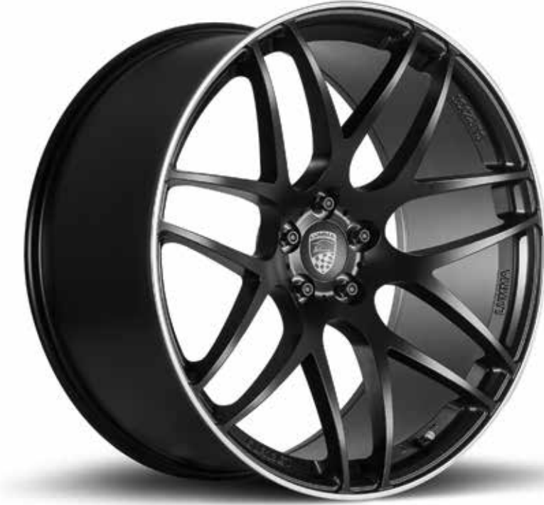
LUMMA CLR 23 GT LUMMA CLR 23 GT

Serie (vorne und hinten): 10x22 Zoll mit Bereifung 295/35-22 Mit Bodykit (vorne und hinten): 12x22 Zoll mit Bereifung 305/35-22 Series (front and rear): 10x22 inch with 295/35-22 tyres With body kit (front and rear): 12x22 inch with 305/35-22 tyres