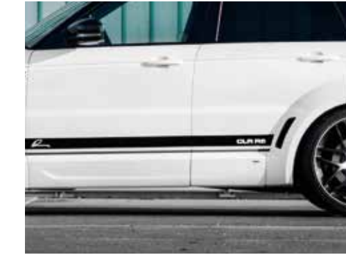
Seitenschwellerverkleidungen mit tiefer Optik. Optionaler Zierstreifensatz in Mehrton-Farbdesign (Serie einfarbig).

Front spoiler bumper with integrated double-daytime running lights in LED fibre-optics technology.