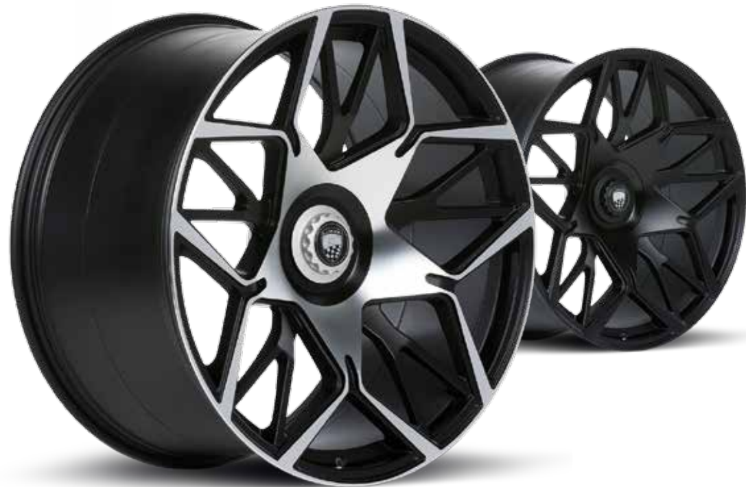
LUMMA - CLR LN1 schwarz poliert / schwarz matt LUMMA - CLR LN1 black polished / black matt

Choose from a wide range of wheels in various sizes and color compositions. All wheels are optionally available as complete wheels with high performance tires.