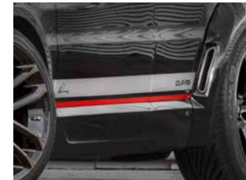
Designstreifensatz in Zweiton-Optik oder einfarbig.

Double-daytime running lights LED-technology chrome (standard)