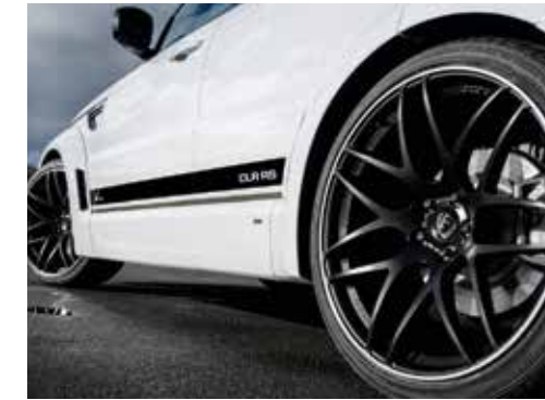
Radsatz LUMMA CLR 23 GT