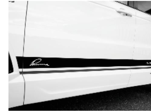
Designstreifensatz in Zweitton-Optik oder einfarbig