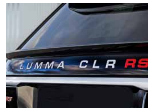
Heckspoilerlippe. Modellschriftzug silber/rot

Diffuser part removable (for vehicles with trailer coupling)