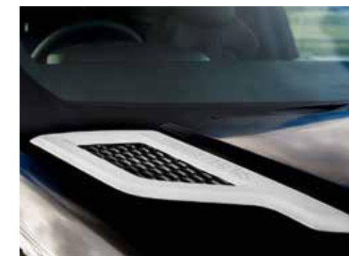
Sportlook-Motorhaubenblenden CLR RS