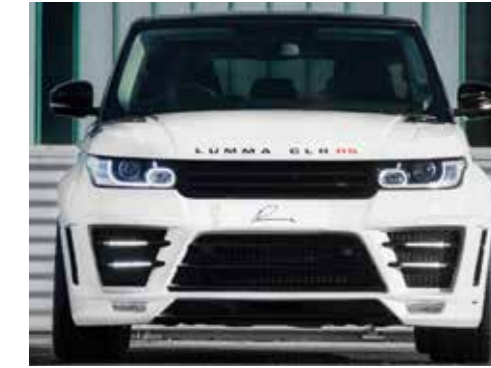
Frontspoilerstoßstange mit integrierten Doppel-Tagfahrleuchten in LED-Lichtleitertechnologie.

They enhance the sporty appearance of the LUMMA CLR RS on individual way.