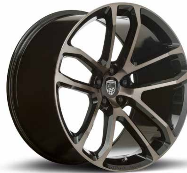
LUMMA - CLR Racing black smoke LUMMA - CLR Racing black smoke

Serie (vorne und hinten): 10x22 Zoll mit Bereifung 295/35-22 Mit Bodykit (vorne und hinten): 12x22 Zoll mit Bereifung 305/35-22 Series (front and rear): 10x22 inch with 295/35-22 tyres With body kit (front and rear): 12x22 inch with 305/35-22 tyres