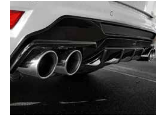
Heckdiffusor in Kontrastfarbe.