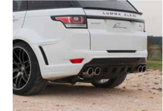
Heckschürzenstoßstange mit integriertem Heckdiffusor. Der abnehmbare Diffusor ermöglicht die Verwendung der Anhängenzugvorrichtung.

Side skirts low version. Optional design stripes set in multi-tone color design (standard: single-tone design).