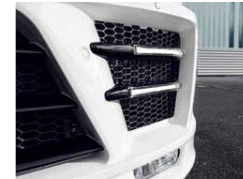
Doppel-Tagfahrleuchten in LED-Lichtleistentech- nologie.