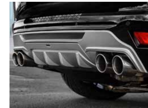
Diffusorteil abnehmbar (für Fahrzeuge mit Anhängenzugvorrichtung)

Design stripes set in multi-tone color design (standard: single-tone design).