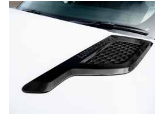
Sportlook-Motorhaubenblenden CLR RS