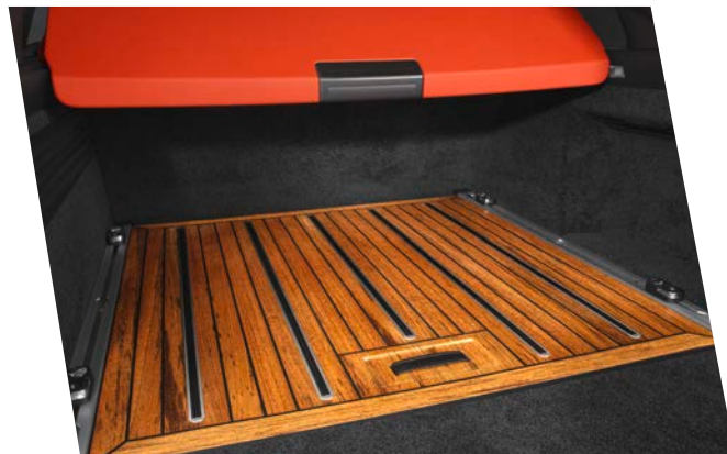
LG-880-10 STARTECH Teak Holzboden für den Kofferraum STARTECH Teak wood floor for luggage space