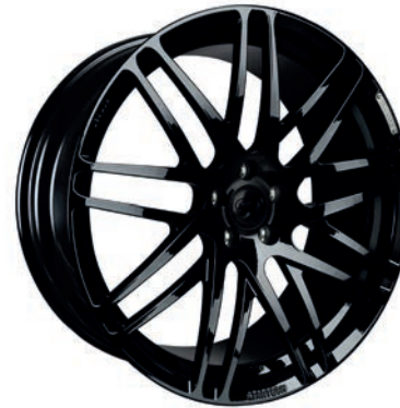
MONOSTAR S , Kreuzspeichendesign, 11J x 23", einteilig, geschmiedet, schwarz glänzend MONOSTAR S , Cross-spoke design, 11J x 23", single piece, forged, glossy black