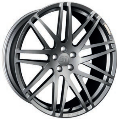
MONOSTAR S , Kreuzspeichendesign, 11J x 23", einteilig, geschmiedet, "Titan" anthrazit matt lackiert MONOSTAR S , Cross-spoke design, 11J x 23", single piece, forged, „Titan“ colour anthracite matt painted