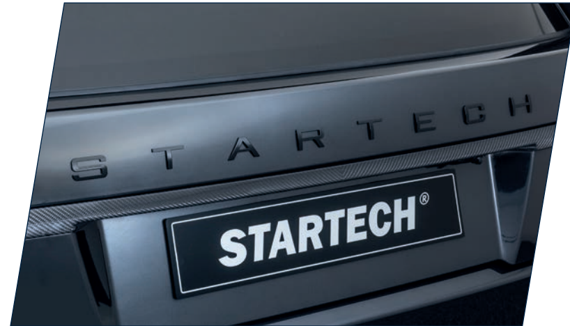
LG-700-40 Carbon Cover Heckdeckelleiste, high-gloss finish Carbon trunk panel cover, high-gloss finish