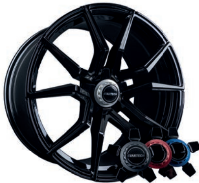
MONOSTAR M , 10J x 22", schwarz glänzend, inkl. Aluminium-Nabenkappe in Zentralverschlussoptik MONOSTAR M , 10J x 22", glossy black, with aluminium center caps in center lock design