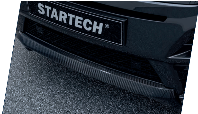
LG-200-02C Carbon Diffusor für Frontstoßfänger LG-220-00, high-gloss finish Carbon diffusor for front bumper LG-220-00, high-gloss finish