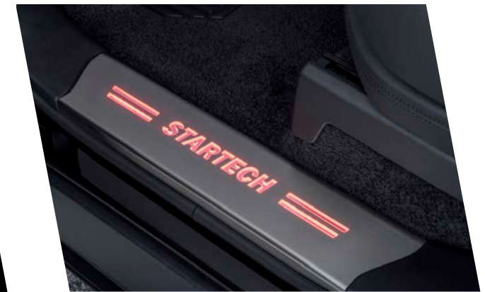
LG-350-00/RT Einstiegsleisten-Satz, beleuchtet in blau oder rot, Edelstahl, 2-teilig Entrance panel set, illuminated in blue or red, stainless steel, 2-pieces