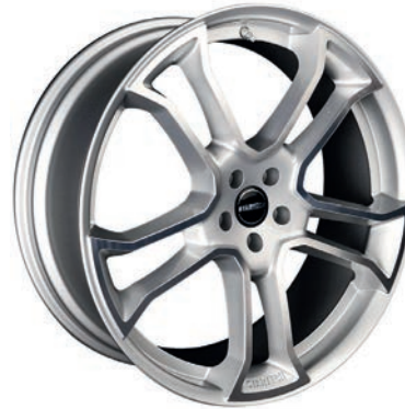
MONOSTAR R , 10J x 22", silber, vollpoliert MONOSTAR R , 10J x 22", silver, full polished