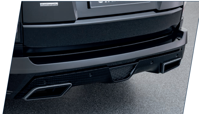
LG-420-02C Carbon Diffusor für Heckstoßfänger LG-420-00, high-gloss finish Carbon diffusor for rear bumper LG-420-00, high-gloss finish