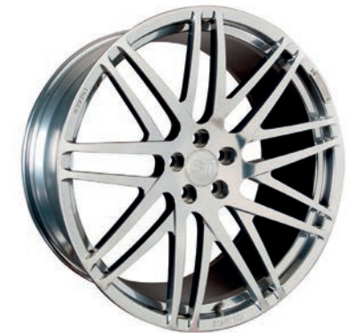
MONOSTAR S , Kreuzspeichendesign, 11J x 23", einteilig, geschmiedet, keramik poliert MONOSTAR S , Cross-spoke design, 11J x 23", single piece, forged, ceramic polished