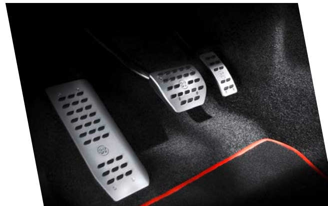
LG-819-00 & LG-819-01 Aluminium Pedalauflagen & Aluminium Fußstütze Aluminium pedal pads & aluminium foot rest