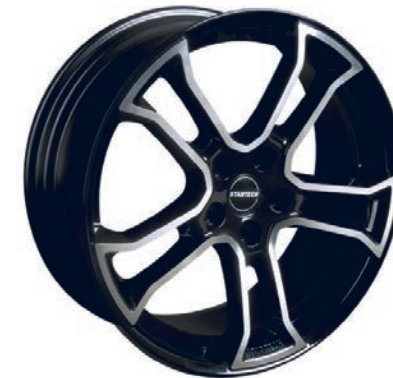
MONOSTAR R , 10J x 22", einteilig, schwarz, Felgenstern silber, vollpoliert MONOSTAR R , 10J x 22", single piece, black, centre star silver, full polished