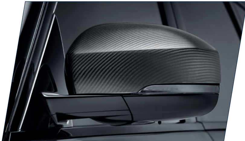
LG-700-30 Carbon Spiegelcover, high-gloss finish, Satz Carbon mirror covers, high-gloss finish, set